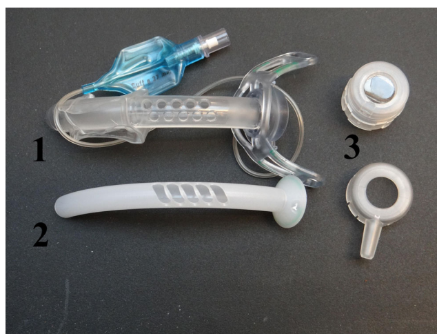
Fig. 3 Canule de trachéotomie fenêtrée : 1) canule externe fenêtrée avec ballonnet basse pression ; 2) chemise interne fenêtrée ; 3) valve phonatoire

la canule de trachéotomie, il est possible d'utiliser ce type de canule appelée canule fenêtrée. Cette canule favorise le passage de l'air vers les cordes vocales et donc la phonation et s'utilise dans cette indication avec une valve phonatoire. Les chemises internes de ce type de canule peuvent être fenêtrées ou non ;