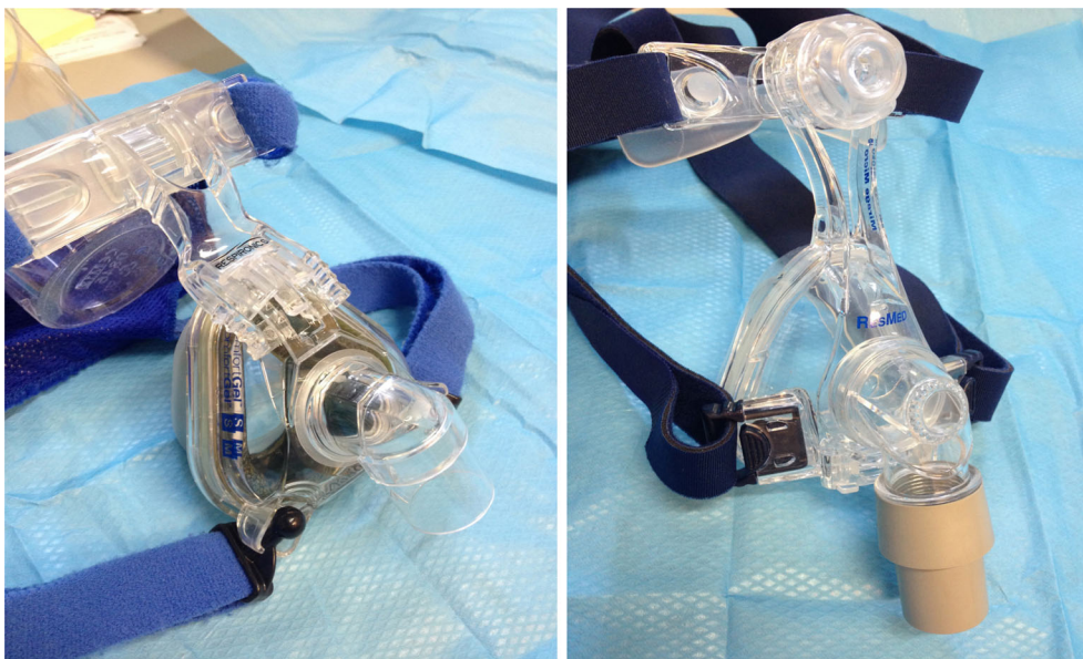
Fig. 7 Masques de type nasal « Respironics® Comfort Gel » et « ResMed® Mirage »

Le masque NB est le plus utilisé en milieu hospitalier dans la ventilation en phase aiguë [10]. Il se caractérise par la