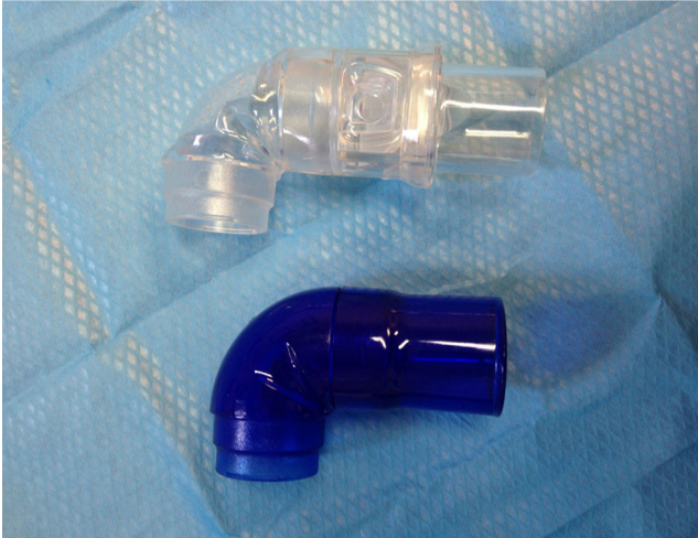
Fig. 4 Coudes avec et sans fuite intentionnelle

Il est important de noter qu'il existe des masques sans fuite à coude transparent, comportant une soupape de sécurité destinée à permettre au patient de continuer à respirer en cas de déconnexion accidentelle ou de panne brutale du respirateur (Fig. 5).