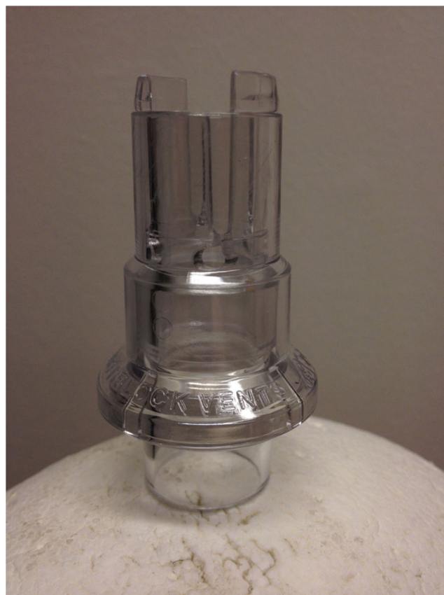
Fig. 3 Whisper Swivel Philips-Respirionics®

Les fabricants de masques industriels proposent en général dans leur gamme le même modèle dans les deux types (coude bleu ou coude transparent). Certains permettent d'interchanger les coudes qui sont fournis tous deux dans le même lot (ex. : FlexiFit de Fischer-Paykel®, Fig. 4).