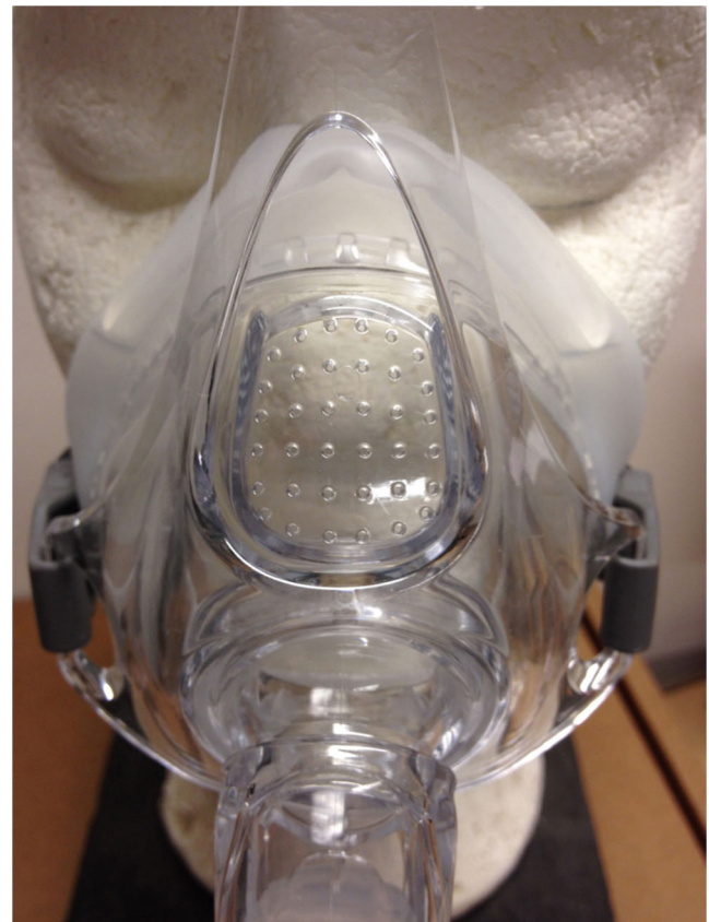
Fig. 6 Fuite intentionnelle sur le masque

Les masques industriels, qu'ils soient de type nasal ou nasobuccal (NB), sont de nos jours généralement composés