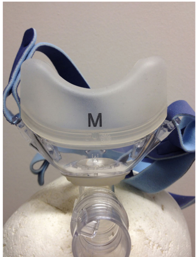
Fig. 10 Indication de la taille du masque

du masque NB, mais recouvrant les yeux jusqu'au front (Fit-Life Total Face de Respirationics®, Shield®) (Fig. 12), l'autre, plus ovale et dotée d'une large lèvre de silicone fin sur le pourtour (Total Face Mask de Respirationics®, Maxshied®). L'étude de Ozsancak et al. [12] a pu montrer un temps de mise en place et un confort égal ou supérieur au masque NB. L'avantage principal est d'éviter la fuite aérienne désagréable