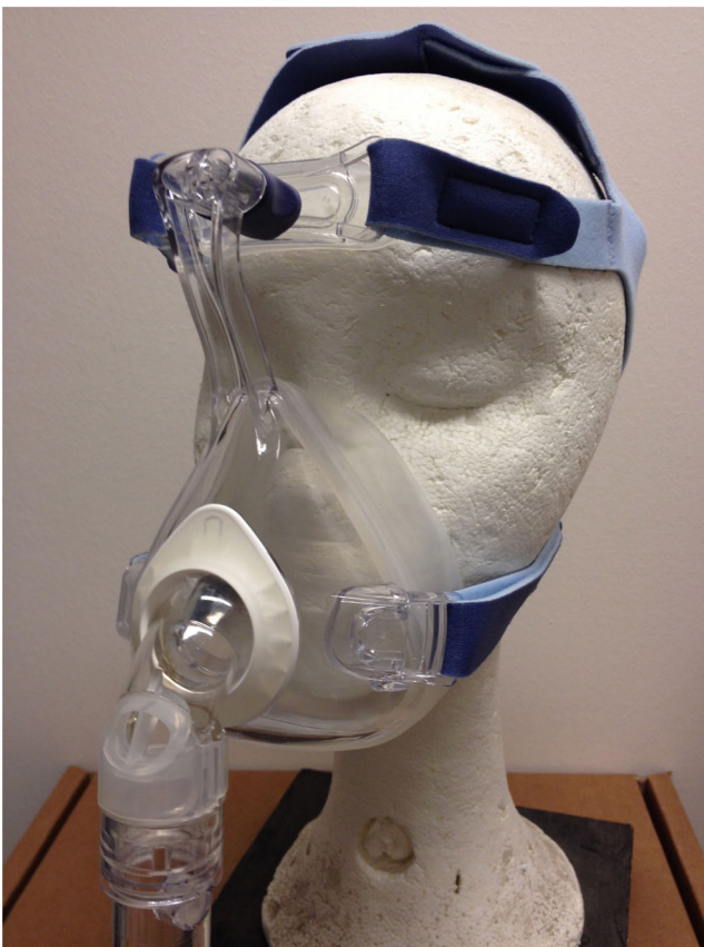
Fig. 5 Masque sans fuite avec valve antiétouffement Weinmann®

Attention, ces « faux amis » peuvent induire une confusion dangereuse !