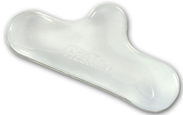
Fig. 14 Protection cutanée ResMed® Gecko

La protection de la peau n'est pas la seule parade à la formation d'une escarre. Lors d'une ventilation prolongée, l'utilisation alternée de plusieurs masques permet de soulager et/ou