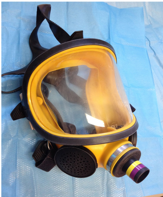
Fig. 11 Masque facial « Dräger® — Bacou »