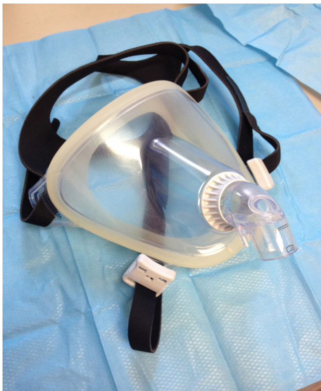
Fig. 12 Masque « Performax — Respirationics® »

pouvant se produire au niveau des yeux. S'il est jugé généralement plus confortable, il provoque néanmoins une sécheresse orale et nasale, ainsi qu'une sensation de claustrophobie [13]. Par ailleurs, lors de son utilisation, si des fuites relativement importantes se présentent, il majore l'asynchronie patient-machine [14].