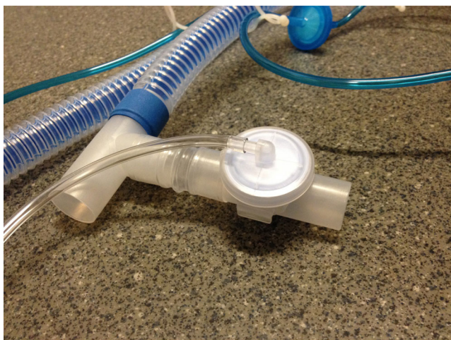
Fig. 1 Circuit de respirateur à valve commandée

Les masques sans fuite, parfois appelés « masques d'anesthésie », à coude bleu, doivent théoriquement ne s'utiliser qu'avec un circuit comportant une valve expiratoire — circuit double branche, comme un respirateur de réanimation par exemple ou avec un respirateur à valve commandée — (Fig. 1). Il est néanmoins possible d'utiliser un masque sans fuite intentionnelle en ajoutant sur le circuit une fuite calibrée (Fig. 2) ou une valve de type « Whisper Swivel » (Fig. 3). Les masques à fuite calibrée (fuite destinée à l'élimination des gaz expiratoires) présentent un coude transparent et s'utilisent avec un circuit monobranche (Fig. 4). Le choix du type de masque devra se faire en fonction du type de respirateur et de circuit utilisé [7].