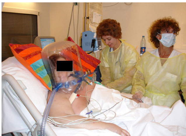
Fig. 13 Helmet

plus notable chez le sujet âgé, à cause d'une condition générale souvent altérée et d'un état immunocompromis [21]. Il en va de même en cas de peaux fragilisées par une corticothérapie au long cours comme chez le BPCO.