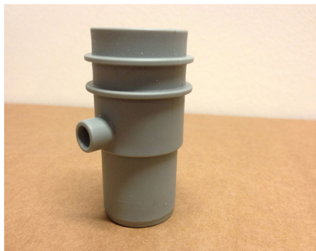
Fig. 2 Valve à fuite calibrée