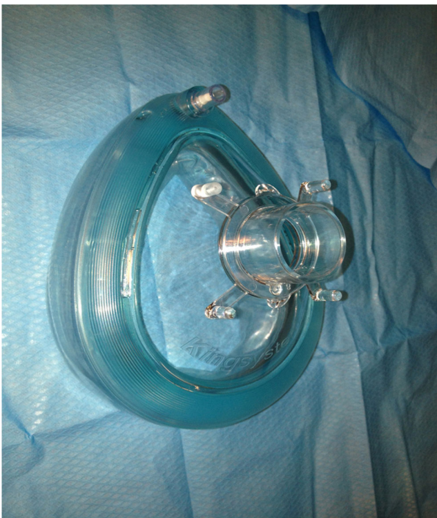
Fig. 8 Masque nasobuccal « King »

Apparu il y a un peu plus d'une dizaine d'années sous la forme d'une variante d'un masque de pompier (Dräger®—Bacou) (Fig. 11) [aujourd'hui plus disponible], il a évolué sous deux formes : l'une, grossièrement triangulaire, dérivant