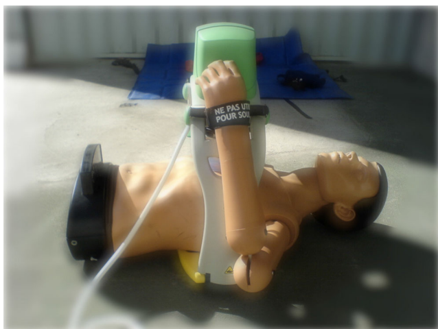
Fig. 1 LUCAS ® (Lund University Cardiac Arrest System) de la société Medtronic ™ .

Le LUCAS ® (Lund University Cardiac Arrest System) de la société Medtronic ™ est actuellement le plus utilisé dans cette catégorie (Fig. 1). Ce système allie les principes de la compression et décompression active par l'intermédiaire d'une ventouse actionnée par un piston pneumatique (propulsé par de l'air ou de l'oxygène) ou électrique (entraîné par un moteur fonctionnant sur batteries). Un arceau mobile supporte le piston qui vient appuyer sur le milieu du thorax du patient. La ventouse permet des compressions thoraciques identiques au massage cardiaque externe manuel et surtout